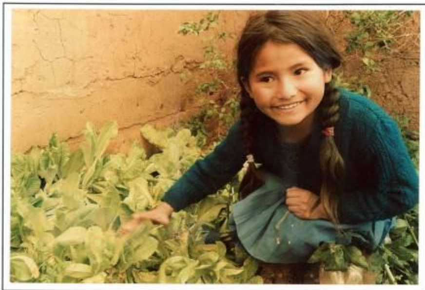
Producción en carpas solares en las Escuelas del Núcleo Escolar de Jaywari