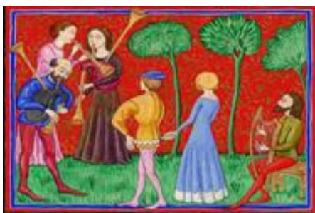
Pareja de danzantes y música chirimía, gaita y arpa