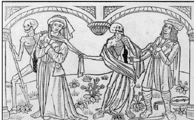
Un trovador y un clérigo arrebatados por la muerte

Hay un texto en castellano de la “Danza de la muerte” que se conserva en un manuscrito de la Biblioteca de El Escorial. En él la muerte va llamando a bailar a diversos personajes como el Papa, el obispo, el emperador, el sacristán, el labrador... al tiempo que les recuerda que los placeres mundanos acaban y todos van a acabar muriendo.