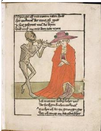
La muerte tocando la flauta

Se ignora cómo era la danza y su música, a pesar de los instrumentos que aparecen en las representaciones iconográficas (la “muerte” toca una flauta, unos timbales...)