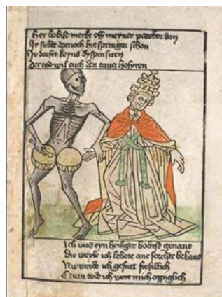
La muerte tocando los timbales